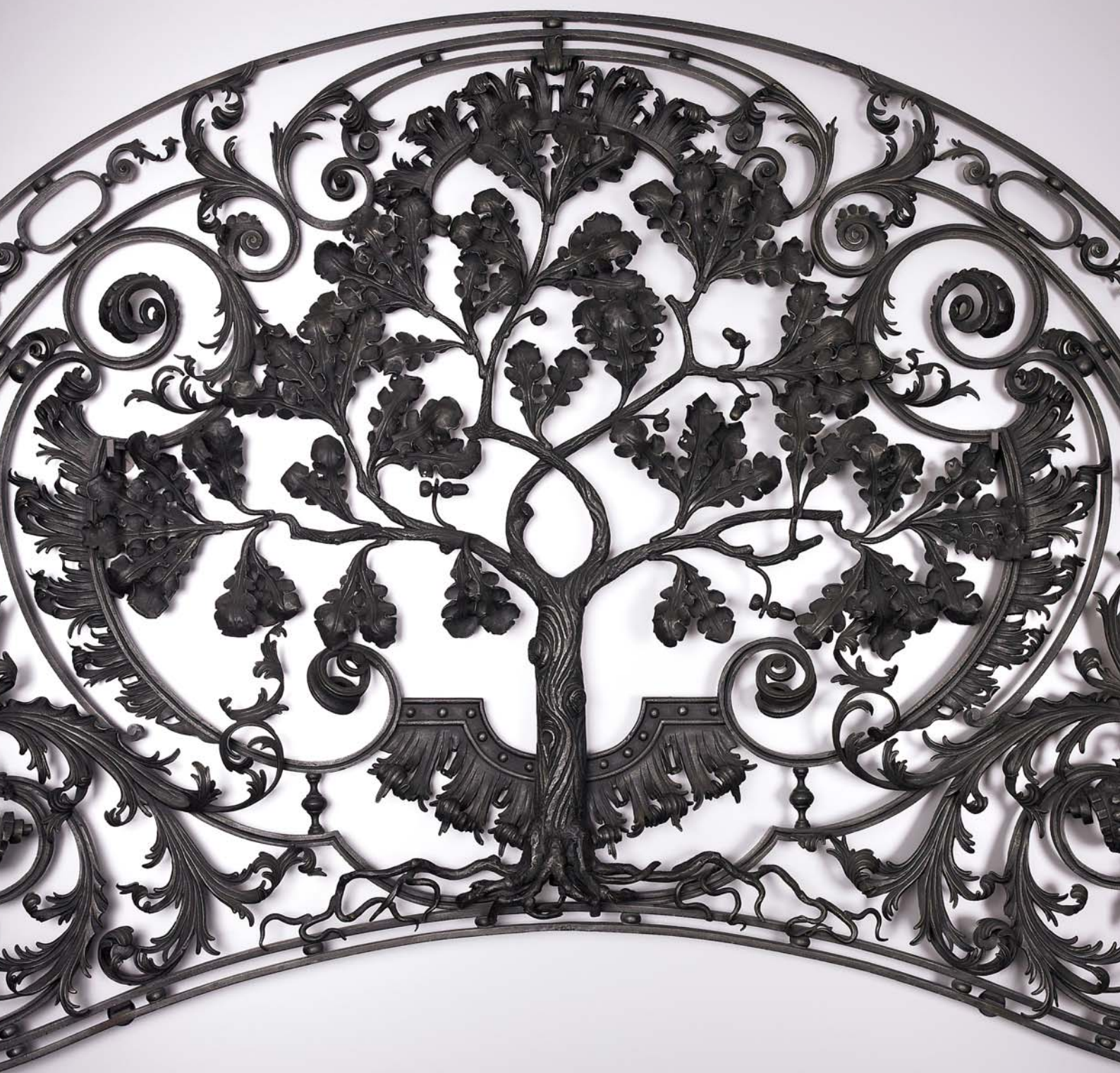
Sarasin – le chêne de Bâle. Fidèle à des valeurs intemporelles.