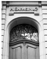
Le bâtiment „zum Eichbaum“ situé à la Freie Strasse 107