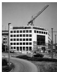
Le nouveau siège de la Elisabethenstrasse